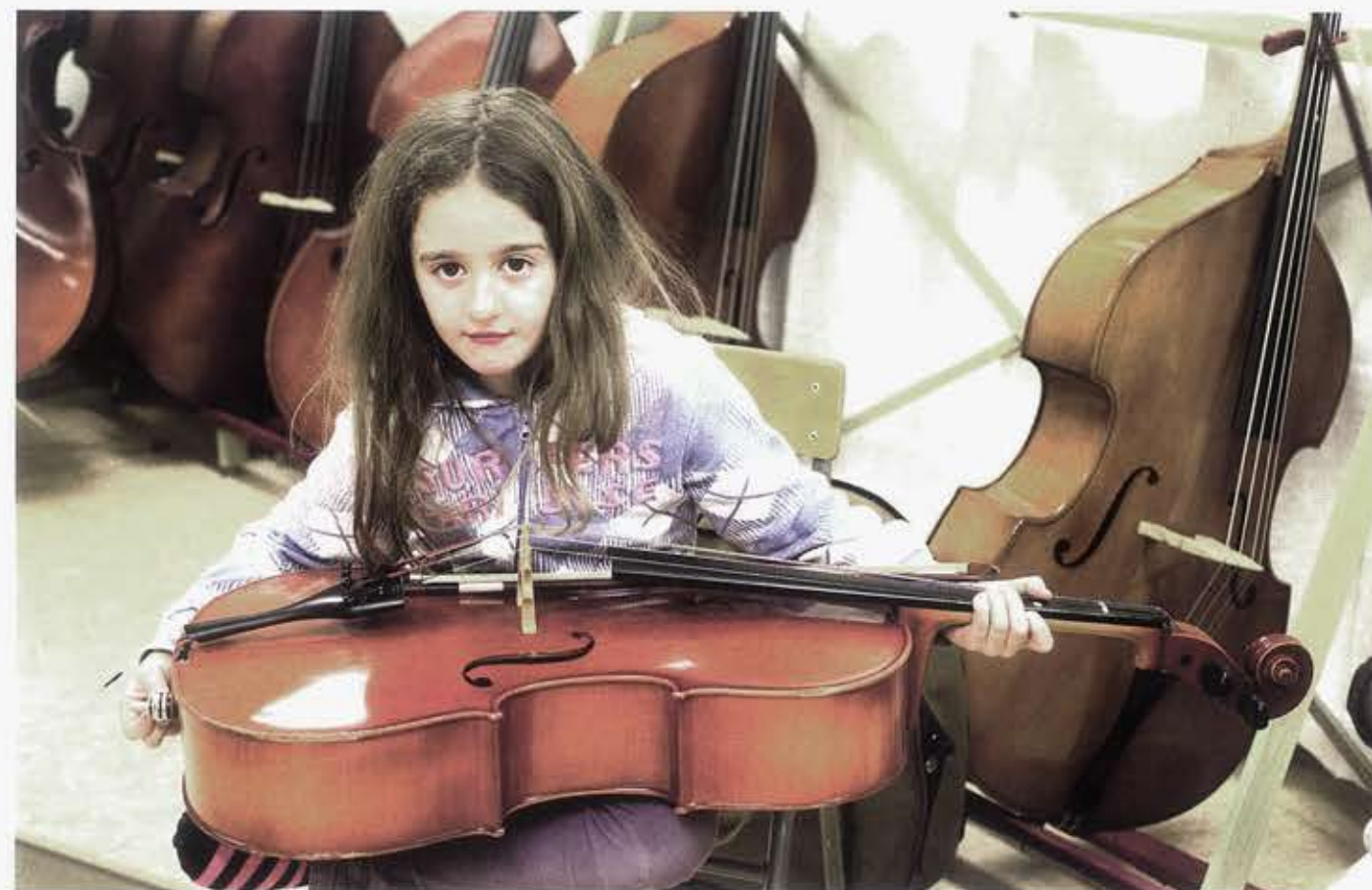
Fatbarda har valt att spela cello i El Sistema.