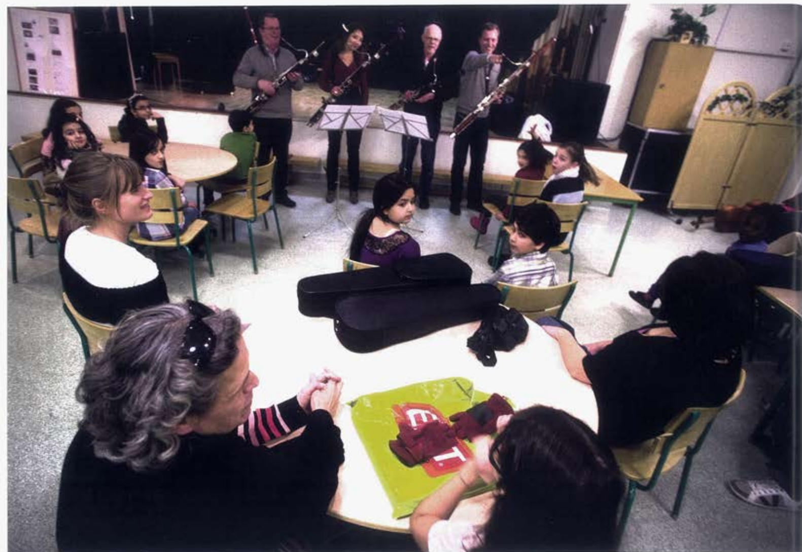
Det blir många frågor till de fyra gästande blåsarna från Göteborgs Symfoniorkester.